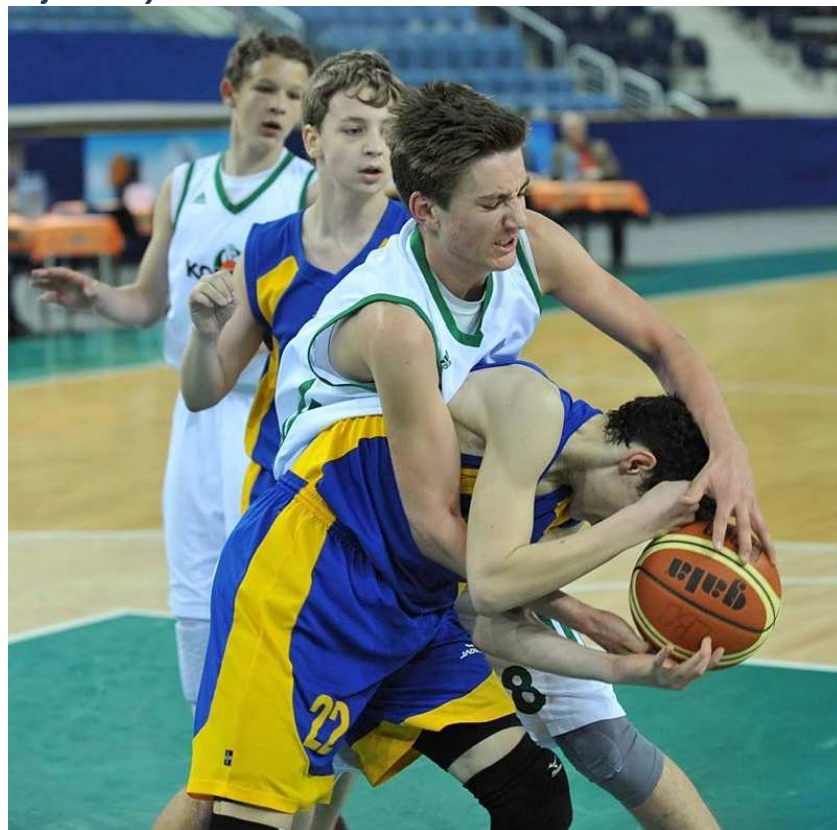
Boj o každý míč